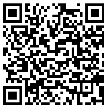
總院 | 交通位置圖

【報名方式】 報名費請以郵政劃撥方式繳納後，請掃 QR Code 進入 Google 表單報名。