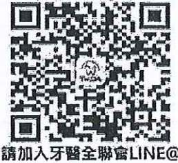
請加入牙醫全聯會LINE@