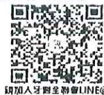
請加入牙醫全聯會LINE