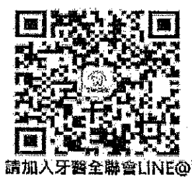
請加入牙醫全聯會LINE@